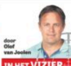
IN HET VIZIER

De flits van 2004 Het laatste jaar van de laatste jaren, daarvoor heeft DNB de pensioeneenheden in een worstregio gehouden. Daar een extreem lage rekenrente verplicht op te leggen. Ter verdediging verdedien die, in het laatste artikel, maar wat dat best niet dat het