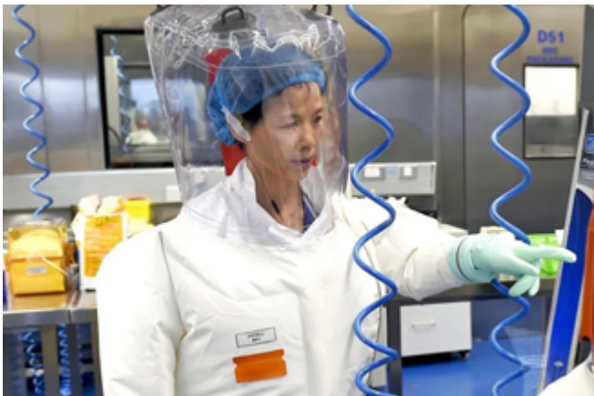
Dr. Shi Zhengli

Een Chinese onderzoekster en expert op het gebied van coronavirussen is volgens journalisten 'gemuilkorfd' nadat ze de genetische samenstelling van het nieuwe Covid 19-virus had ontrafeld. Zij leidde het virus terug naar grotten in Yunnan. Precies daar was het Wuhan Institute of Virology bezig met onderzoeken waar de Amerikaanse overheid ruim $ 3 miljoen voor heeft uitgegeven.